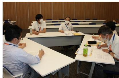
〈7月30日(金) ハッピーライフセミナー風景〉