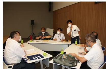
〈7月23日(金) ハッピーライフセミナー風景〉